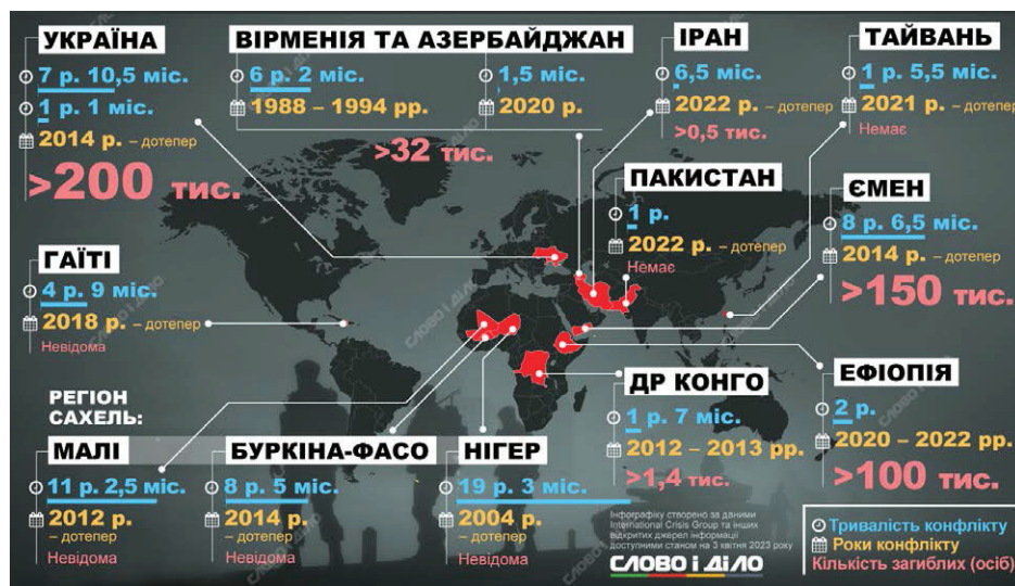
Рис. 2. Збройні та політичні конфлікти у 2023 році (за версією Міжнародної кризової групи)