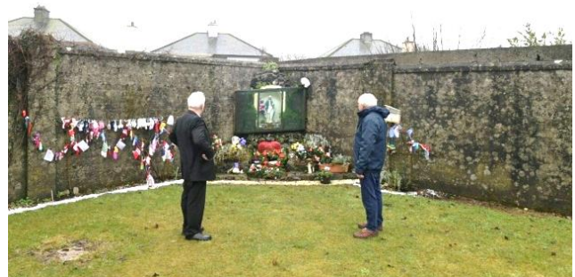
Меморіал на місці масового поховання дітей у притулку м. Туам

За результатами досліджень історикині Кетрін Корлесс записів про неофіційне поховання 796 дітей з будинку матері і дитини без зазначення обставин їхньої смерті було виявлено масове поховання віком від 2 днів до 9 років у резервуарі для стічної води на території притулку у м. Туам, який утримувало католицьке чернече об'єднання Bon Secours [5]. Такий факт спричинив офіційне розслідування діяльності притулків урядом Ірландії у 2015 р.